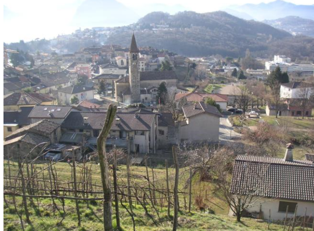
Comano oggi

Esso non va utilizzato per scopi promozionali o per chiedere sempre maggiori contributi al cittadino, ma deve essere un valore stabile, libero da strumentalizzazioni, che accompagni i progetti futuri, garantendo una serie di servizi che devono rimanere di alta qualità.