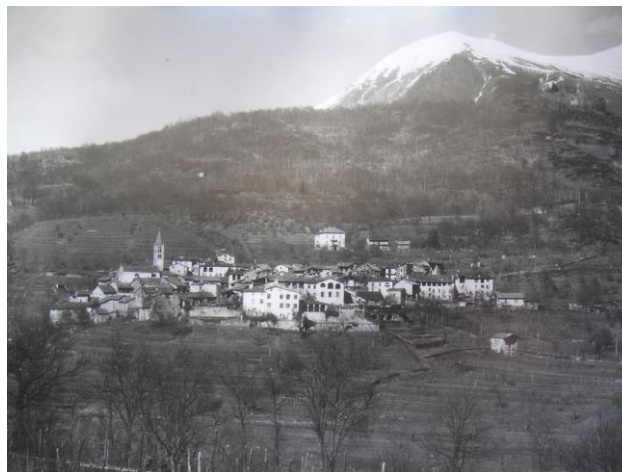
Comano – anni '30

Gli impegni finanziari del comune non sono indifferenti ma favoriscono la buona qualità di vita e l'appetibilità del comune come zona residenziale preferita.