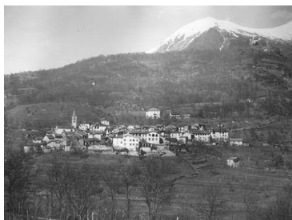
Comano nel 1940

Quattro anni fa ci avete offerto una grande opportunità, ora vi chiediamo di confermarla.