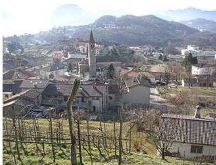
Comano nel 2000